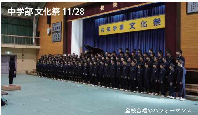
中学部 文化祭 11/28