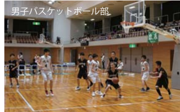
男子バスケットボール部