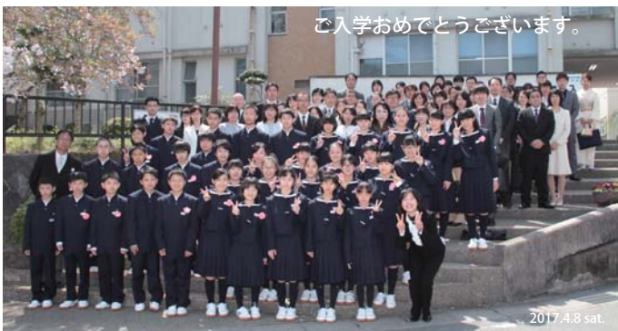
ご入学おめでとうございます。