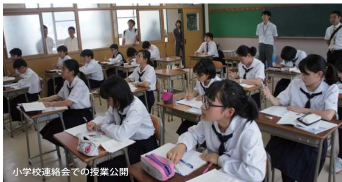
小学校連絡会での授業公開