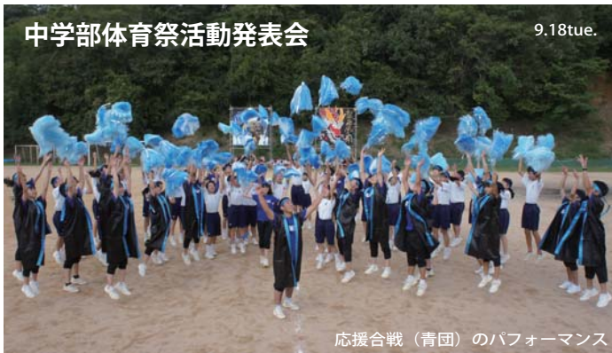
応援合戦（青団）のパフォーマンス