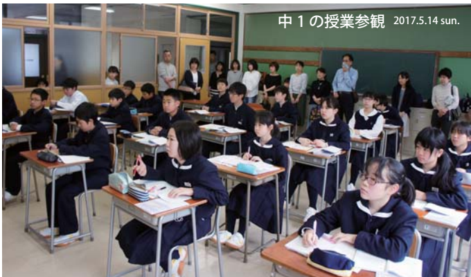
中1の授業参観 2017.5.14 sun.