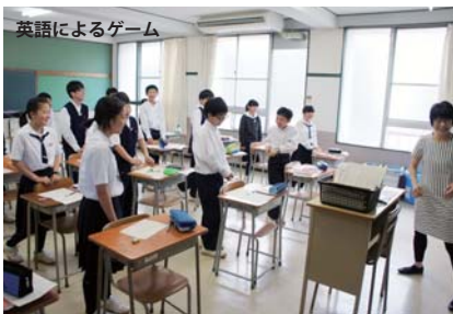
英語によるゲーム

連休明けにはバタビア特進コースの保護者会総会が開催され、授業参観や学級保護者集会もありました。中1は初めての参観授業で緊張気味です。学校生活にも少し慣れて来たところですが、中間考査2週間前から、学習計画を各自が立てて、それを実行するというキャンペーンが担任の指導により実施されています。