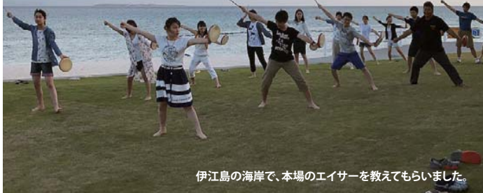
伊江島の海岸で、本場のエイサーを教えてもらいました。