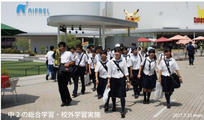
中2の総合学習・校外学習実施