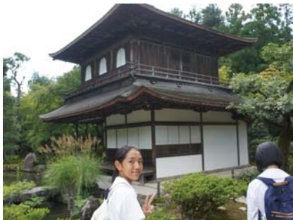
京都での調査活動中

中3の目玉であるバタビアゼミは、各指導教官との打ち合わせがはじまり、個人やグループでの活動テーマが決まりつつあります。早いところではこの夏休みに現地調査活動やフィールドワークも実施していたようです。