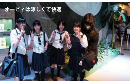
オービィは涼しくて快適

中2では生徒たちが旅行会社を作って、校外学習プランのプレゼンを行いました。保護者、先生も含めて投票した結果選ばれた、担当の会社によって実際の行程や、事前事後学習も含めて企画化され、補習最終日に実際に校外学習を実施しました。まさにツアーガイドのような担当班の頑張りで楽しく、また中身のある素晴らしい校外学習となりました。担当班はご苦労様でした!!