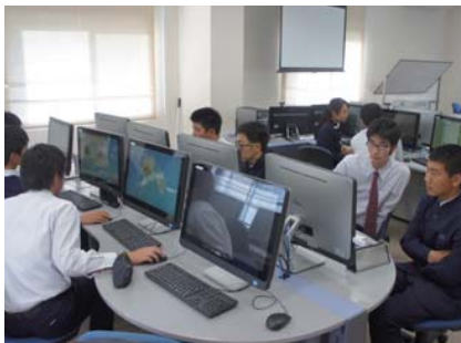
情報教室で指導教員と打ち合わせ

【中3バタビアゼミ②】→ 指導教員が手探りの状況でもありますが、3学期の発表会に向けて、どのような形で発表するかを決める必要があります。まずは大まかな研究活動全体の計画とが必要となっていますが、まだまだ漠然としているチームが多いようです。