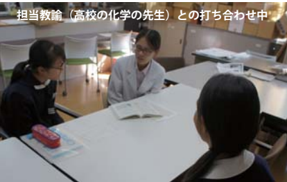
担当教諭（高校の化学の先生）との打ち合わせ中

昨年度からはじまった考査前の朝学習。名付けてモニスタ(morning study)の略朝のホームルーム前の時間、普段は朝読書をしたりする時間ですが、試験前の一週間はテスト対策の学習時間として有効に使っています。参加しなくても良いのですが、中1ではほとんどの生徒が、自習に取り組んでいます。定期考査に向けて良い意味で「点取り虫」になっています。強制ではないので、中2~中3になるとそれぞれのペースを優先して、参加者は減少して行きます。