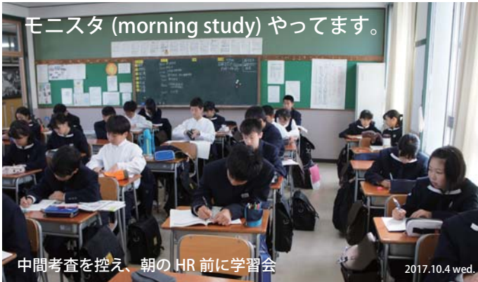
モニスタ (morning study) やってます。