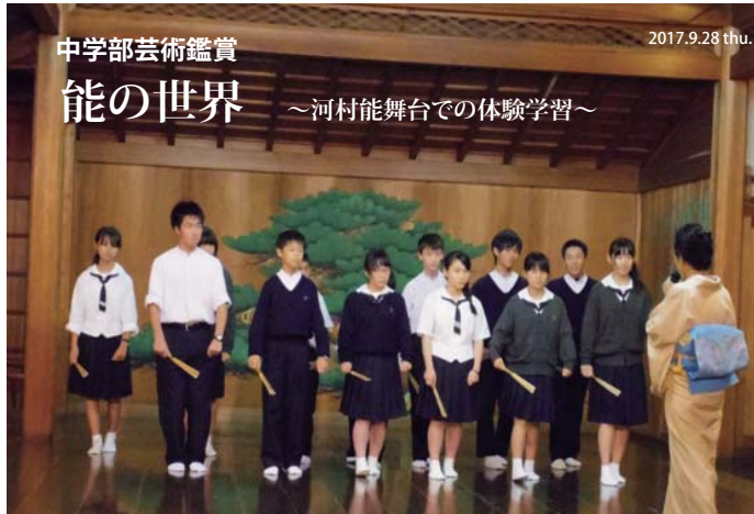
中学部芸術鑑賞 能の世界 ~河村能舞台での体験学習~