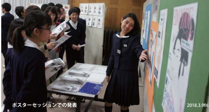
ポスターセッションでの発表