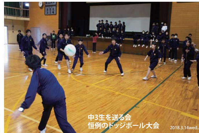
中3生を送る会 恒例のドッジボール大会

生徒会による最初の行事がこの3年生を送る会になります。例によってドッジボール大会や8の字飛びのクラスマッチなど、ゲームの他、吹奏楽部の演奏やビデオメッセージなど、卒業を前にした3年生と最後の行事を楽しみました。