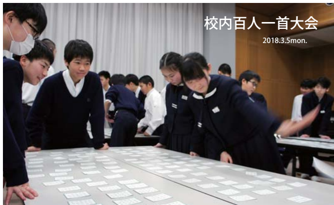
校内百人一首大会